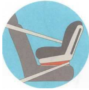
Лицом против движения